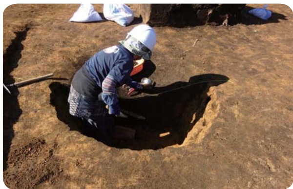
【洋野町・南玉川Ⅳ遺跡 調査の様子】

洋野町では、昨年度に引き続き、西平内Ⅰ遺跡の内容確認調査を、岩手県立博物館と共同で実施しており、縄文時代後期後葉の土器や土製品などが確認されています。また、同じ洋野町では、民間開発事業に伴う北玉川Ⅱ遺跡、南玉川Ⅳ遺跡から、狩場として利用が想定される陥し穴状の遺構が見つかっています。