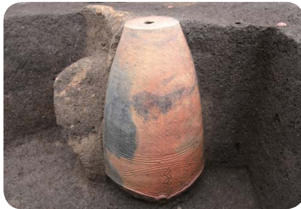
宮古市 高根遺跡 埋甕の出土状況 (縄文時代中期)

発行 岩手県立埋蔵文化財センター 編集 (公財)岩手県文化振興事業団埋蔵文化財センター 〒020-0853 岩手県盛岡市下飯岡11-185 電話：019-638-9001 E-Mail：i-maibun@echna.ne.jp URL：http://www.iwate-maibun.jp/ 発行日 令和3年6月30日 印刷 東京カラー印刷株式会社