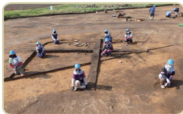
大谷地Ⅲ遺跡 奈良時代の竪穴住居跡の調査