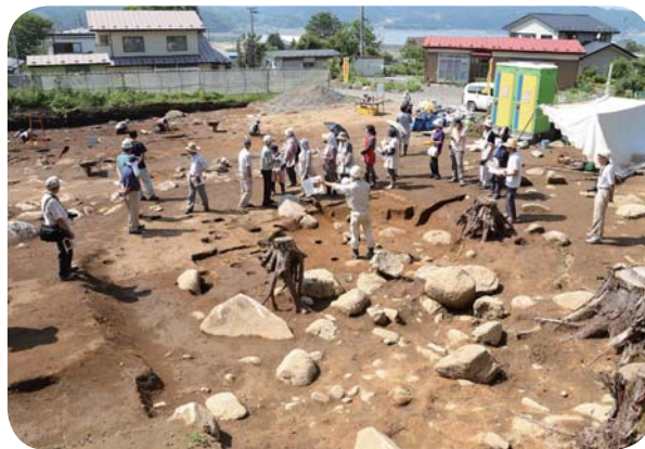
宮古市 赤前皿遺跡 現地公開のようす