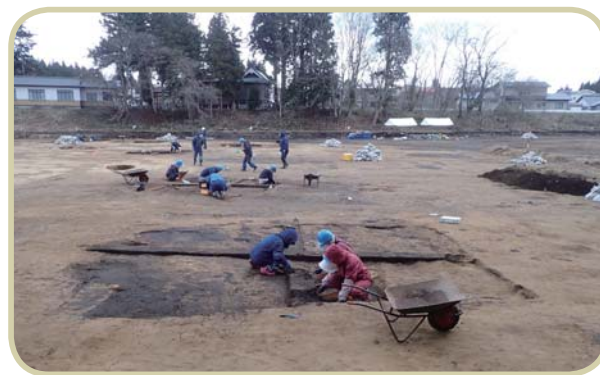
明神下遺跡 今年もたくさんの住居跡を調査します