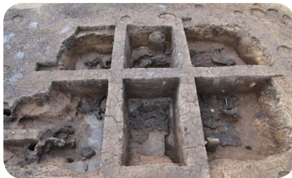
焼失した竪穴建物 東から

作事(建物などを作る建築工事)に関わる遺構として竪穴建物、掘立柱建物、門、柵・塀などが見つかりました。竪穴建物は21軒あり、平面