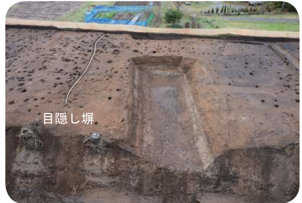
堀と土橋、目隠し塀 東から