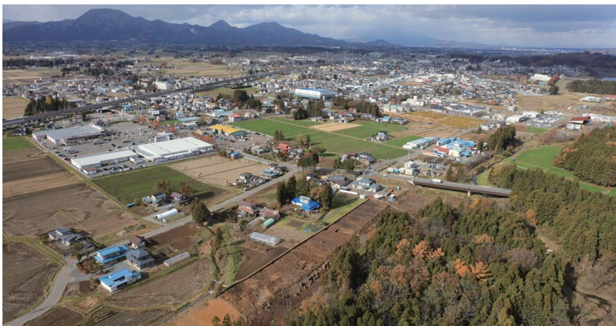
遺跡全景 南東から

北条館跡については、文献史料がほとんどなく城主や築城年は不明ですが、天正18(1590)年に豊臣秀吉が南部信直に交付した朱印状にある命令に従い、城の破却を行ったことを申告した目録である『南部大膳大夫分国内諸城破却共書上』にある「志和郡肥爪平城」とする説があります。