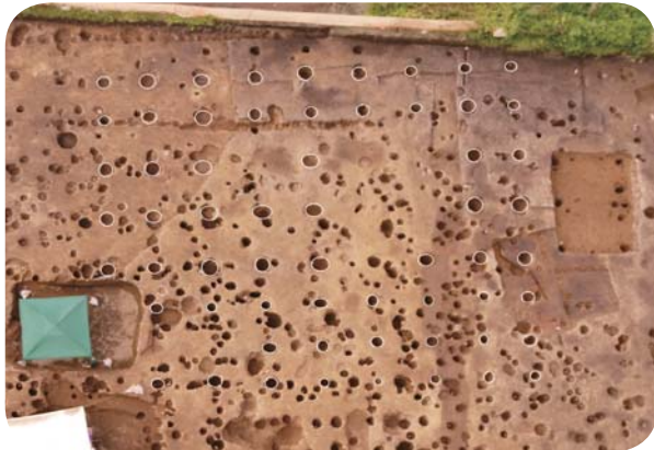
最大の掘立柱建物 直上から

門は四本柱の棟門で、同じ位置で建て替えが行われていました。柵・塀は溝状のもので、通路の側溝や土橋の前の目隠しとして設置されていました。