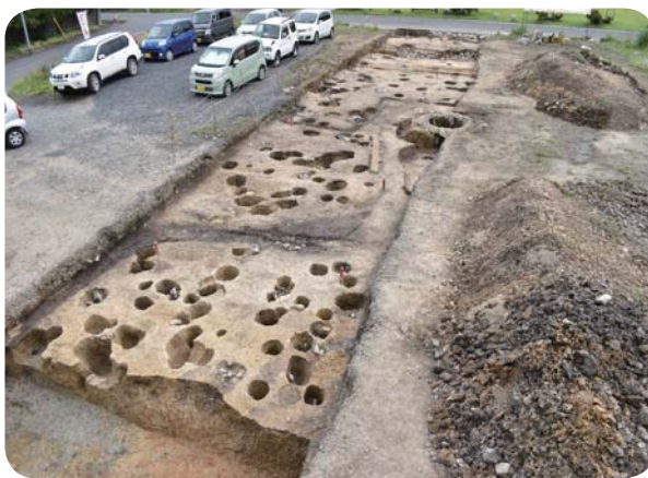
【花巻市・花巻城跡 調査の様子】

史跡整備の内容確認調査として、盛岡城跡では、建物の礎石となる根石が64個、柱列が4列、二戸市の九戸城では、二ノ丸大手の土橋部分で石垣、釜石市の橋野高炉跡では、大工長屋想定地において建物跡1棟がそれぞれ確認されています。